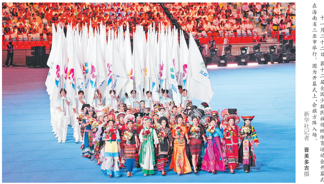
十一月二十二日,第十二届全国少数民族传统体育运动会开幕式在海南省三亚市举行。图为开幕式上,会旗方阵入场。

本届运动会为期9天,6960名各族运动员参加18项竞赛项目和170个表演项目的比赛。运动会期间还举办民族大联欢等文化活动。